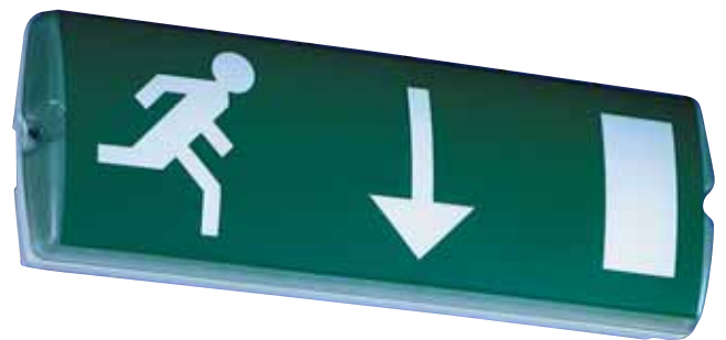
Afb.1 Prisma P8110 signalisatie en noodverlichting armatuur Afb.2 Prisma P8111 signalisatie armatuur met pictogram plaat